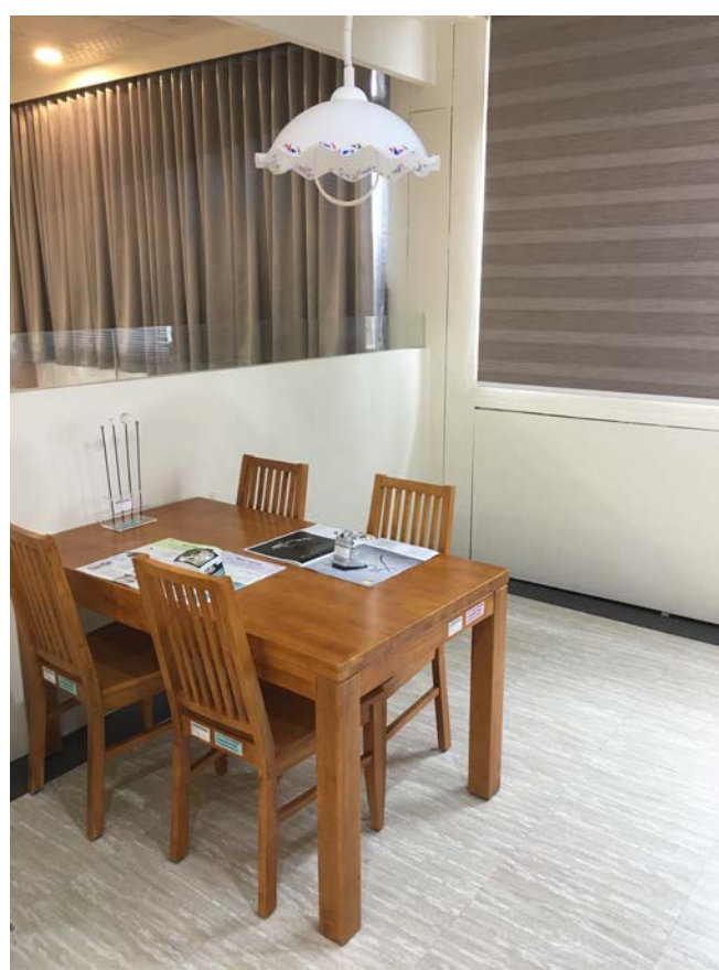
低視力患者居家餐桌規劃