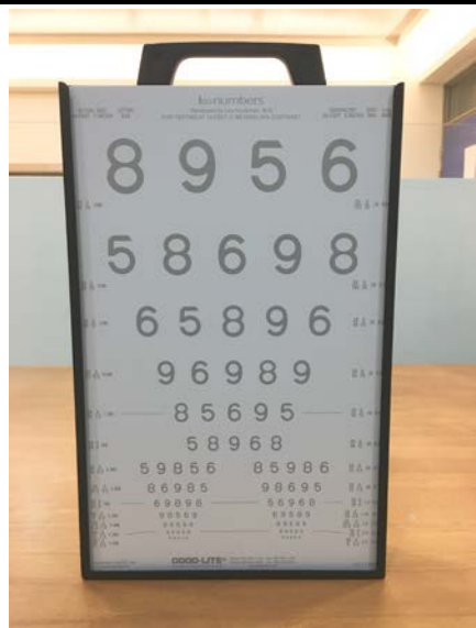
對比敏感度檢查組