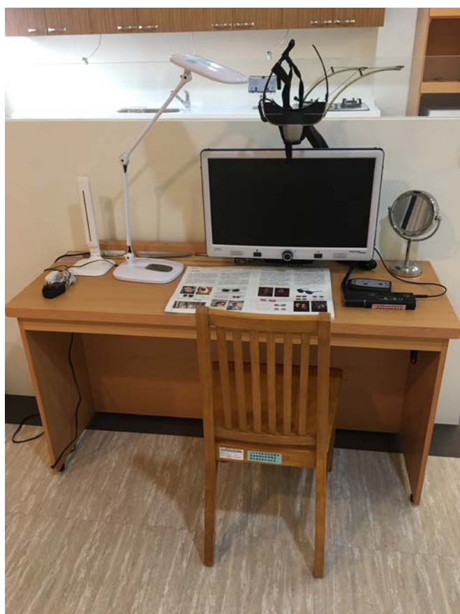
低視力患者閱讀桌空間規劃