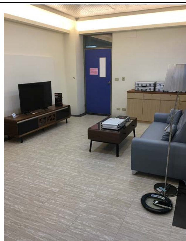
低視力患者居家客廳空間規劃